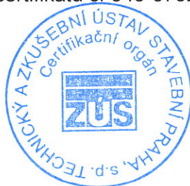
Razítko certifikačního orgánu

Tato příloha je nedílnou součástí certifikátu č. 040-079247.