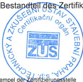
Stempel der Zertifizierungsstelle

Diese Anlage bildet einen untrennbaren Bestandteil des Zertifikats Nr. 040-079245.